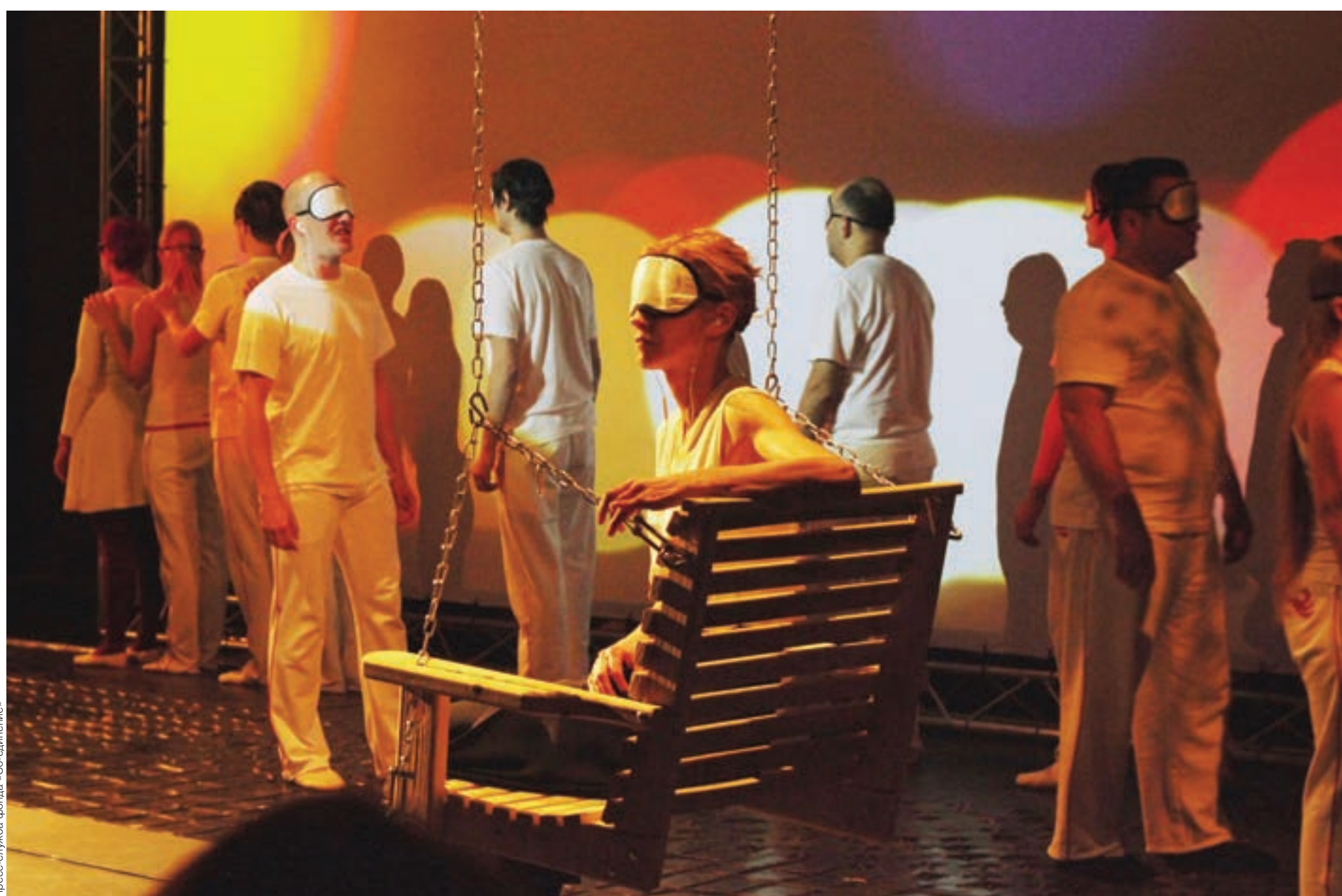
Плещ-служба фонда «Со-единение»

И все же как распознать настоящий разрушительный цинизм? Главный критерий – те ценности, которыми руководствуется человек. «Благен муж, который не ходит на совет нечестивых и не стоит на пути грешных, и не сидит в собрании развратителей» (псалом 1.1). ■